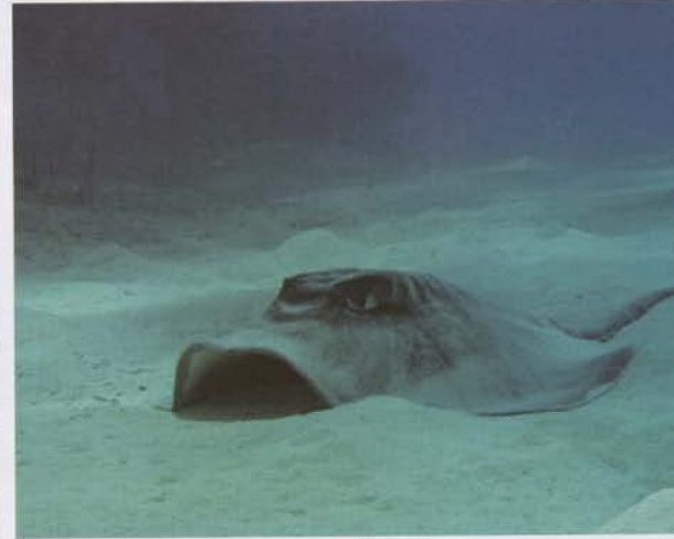
Acque limpide con pareti ricche di gorgonie e grandi spugne, barbagrignatori passano indisturbati, trigoni che ondeggiavano su pianori sabbiosi: sono innumerevoli gli spunti offerti dai fondali dei Los C